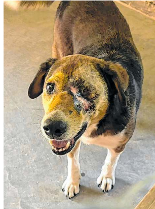
Shrek está em tratamento