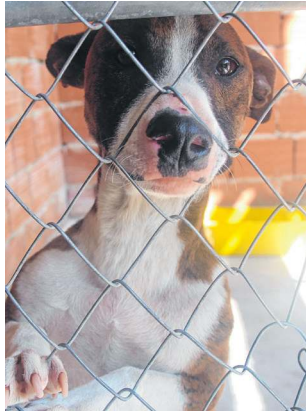
Fogue: atingido por fogos