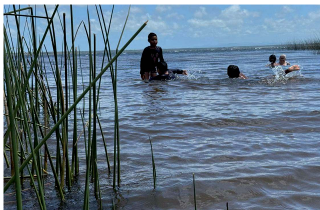
Crianças aproveitam o dia quente para se banhar no lago