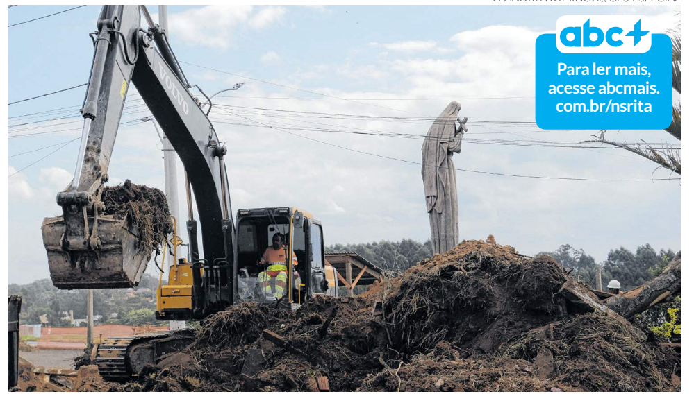
Construção do viaduto sobre a rodovia chama atenção de quem passa pelo local