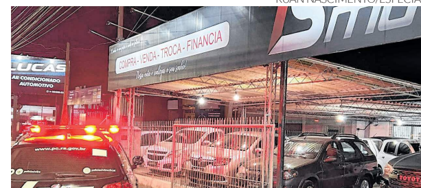
TS Motors foi invadida por bando armado na segunda