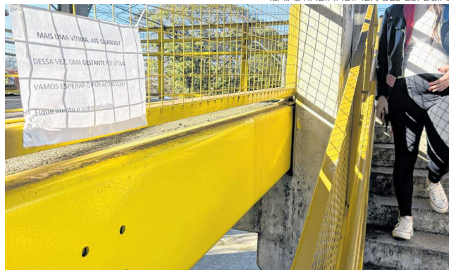
Outro cartaz foi colocado após crime contra grávida