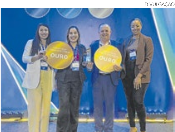
Cidade conquista Selo Ouro do Sebrae