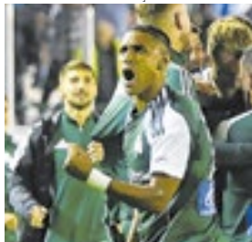
Tetêjoga no Panathinaikos