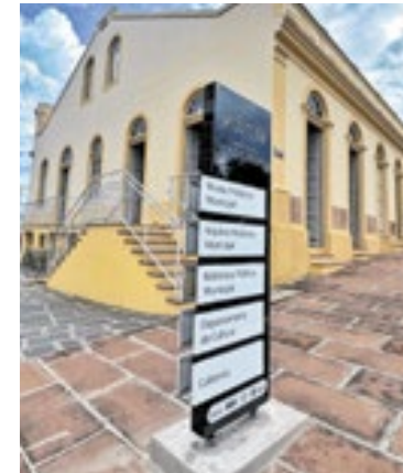
Casa Vidal abriga o Museu Histórico Municipal Adelmo Trott

ao Dia Internacional dos Museus, celebrado em 18 de maio.