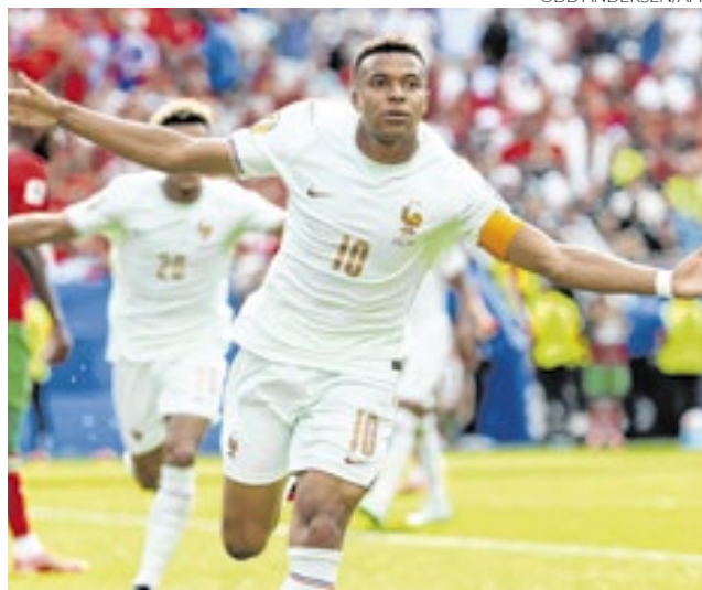
Mbappé marcou o primeiro gol da França sobre Marrocos

A bola sempre oferece uma segunda oportunidade a quem sabe tratá-la bem. Mbappé buscava, então, o jogo o tempo todo e gerava ações para os companheiros. Quando conseguiu uma brecha, o atacan-