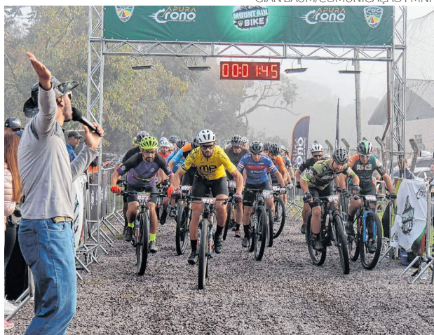
Competição contou com mais de 200 ciclistas

A programação teve início ainda pela manhã, na localidade de Linha Olinda. A partir das 8 horas, os atletas largaram do campo da Sociedade Irmandade para encarar um