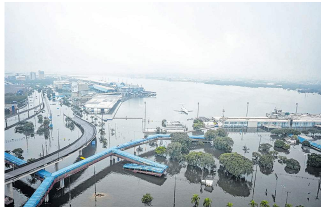
Aeroporto ficou alagado na enchente em 2024