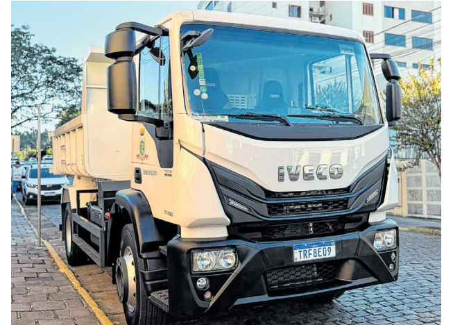
Caminhão integra a frota da Secretaria de Agricultura