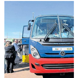
Veículo foi entregue pelo Ministro da Saúde

rança e dignidade aos pacientes”, avaliou.