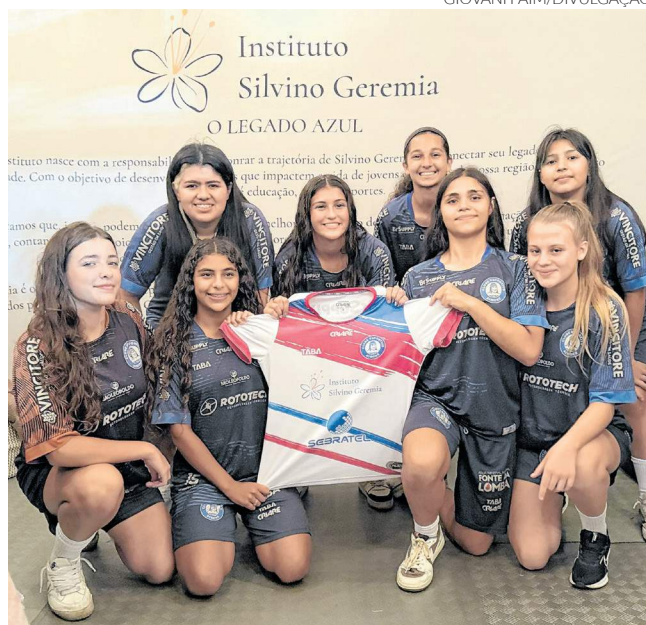
Projeto Índias Capilé tem apoio do Instituto Silvino Geremia

Cada plano tem valores e contrapartidas definidos de acordo com a capacidade de cada interessado. Mais informações sobre como participar podem ser acessadas no website www.institutosilvinogeremia.com.br