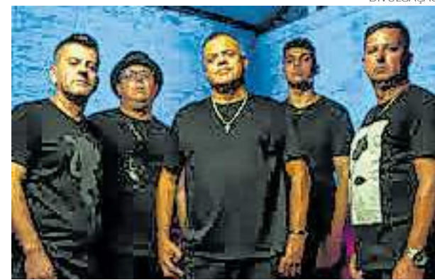
The Best Groove toca clássicos nacionais e internacionais

Setembro é o mês em que esta árvore floresce, coincidindo com o nascimento dele, no dia 20, data que define a própria essência gaúcha”, emociona-se.