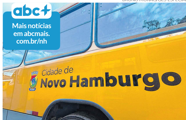
Unificação de linhas e ampliação de itinerário entre mudanças

Além da unificação das linhas Santa Clara e Princesa Isabel, o município con-