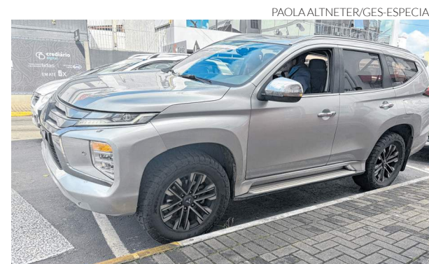
Uma circulada no Centro permite flagrar dificuldade