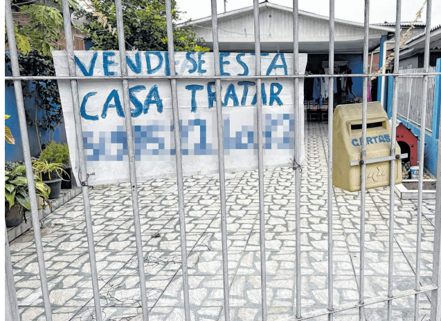
Casas continuam à venda em área afetada pelas enchentes

A pesquisa identificou que 726.358 domicílios tiveram pelo menos um morador que precisou passar uma noite ou mais