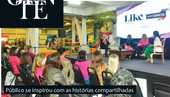
Público se inspirou com as histórias compartilhadas