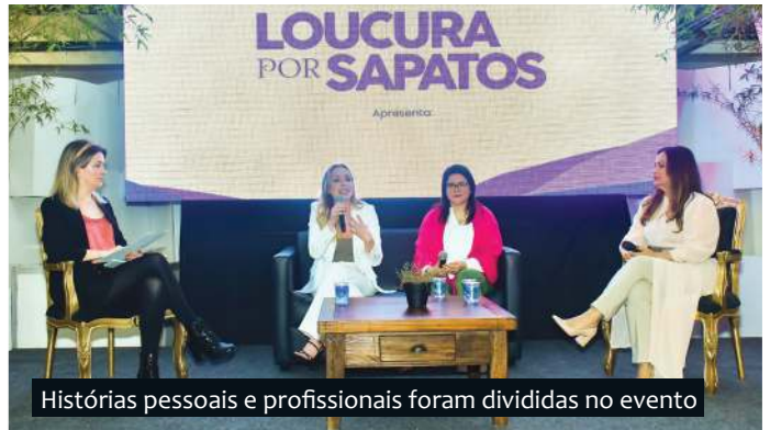
Histórias pessoais e profissionais foram divididas no evento