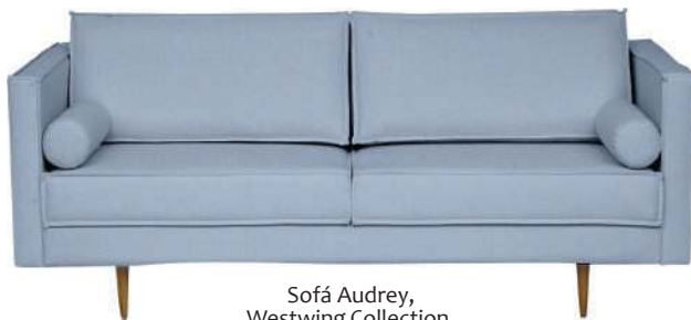
Sofá Audrey, Westwing Collection, R$ 2.749