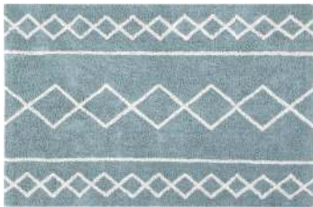
Tapete Oasis, Lorena Canals, R$ 1.089

A nomenclatura varia e o tom ganha pigmentos diferentes, mas há algo inegável: o azul-claro é uma aposta certa para 2025. Na decoração, a escolha está amplamente presente em enxovais relaxantes, mas, a seguir, a curadoria convida a explorá-la em acessórios e mobílias que demonstram sua versatilidade — e provam que, sim, azul é a cor mais quente.