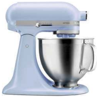
Batedeira Artisan, KitchenAid, R$ R$ 3.199

Lugar americano Pyxis, disponível em Westwing, R$ 27,90