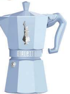
Cafeteira Moka Express Exclusive, Bialetti, R$ 509,90