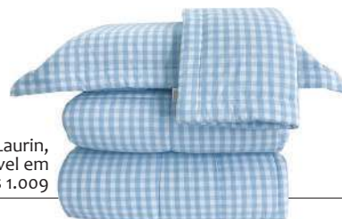
Edredom Laurin, disponível em Westwing, R$ 1.009