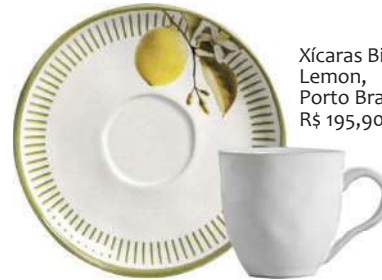
Xícaras Bio Lemon, Porto Brasil, R$ 195,90