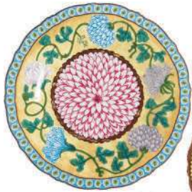
Aparelho de jantar Cravo e Canela, Tania Bulhões, R$ 2.820