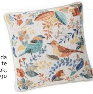
Almofada bem que te vi, Tok&Stok, R$ 87,90