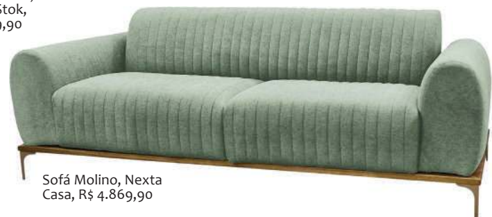
Sofá Molino, Nexta Casa, R$ 4.869,90