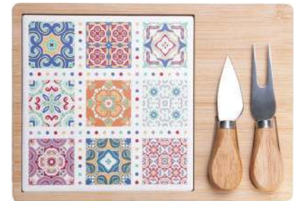
Jogo para Queijo Ladrilho IV, Wolff, R$ 72,90