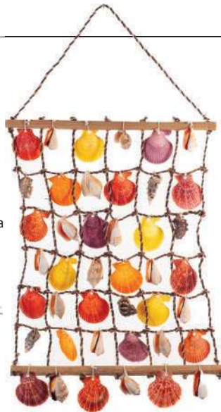
Cortina de conchas, Conchas & Artesanato, R$ 150