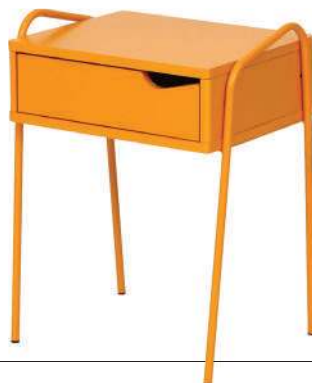
Mesa Fluss, Tok&Stok, R$ 419,90