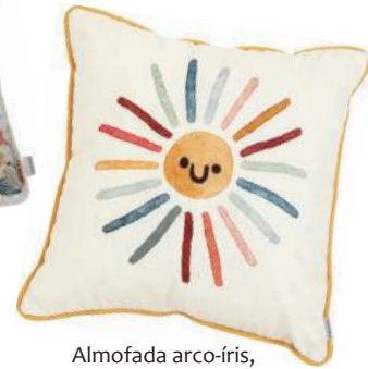
Almofada arco-íris, Speciatta, R$ 99,90