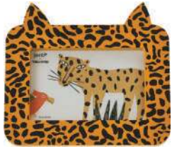
Porta-retrato Bicharada, Bento, R$ 55,90