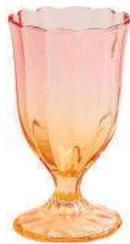
Conjunto de 6 taças Blush Garden, Casa Kauá, R$ 190