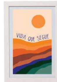
Quadro Vida Que Segue, Disconnect Home, R$ 122,90