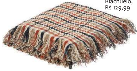
Manta decorativa London, Casa Riachuelo, R$ 129,99