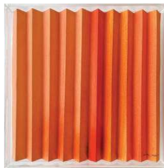
Quadro Degradê Siena, L'Atelier Lavoisier, R$ 449,90