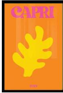
Quadro Capri, Lartestudio, R$ 289,90