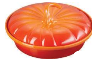
Travessa Abóbora, Le Creuset, R$ 989