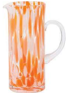
Jarra Paki, em Westwing Now, R$ 144,90