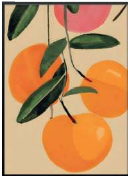
Quadro Laranja Tutti, Inspira Decore, R$ 215