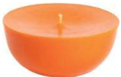
Vela Luna, Fau Home, R$ 119,90