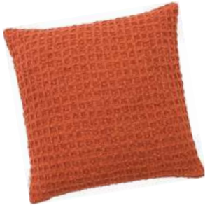
Almofada Alveário, Tok&Stok, R$ 87,90