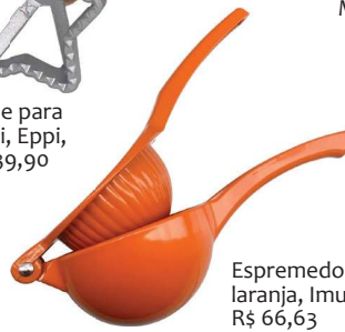
Espremedor de laranja, Imusa, R$ 66,63