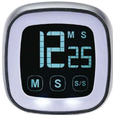
Timer digital, Ghidini, R$ 129,90