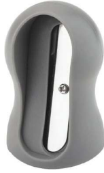
Descascador em espiral, James F., R$ 22,90