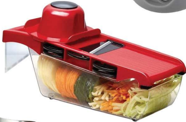
Mandoline, Topen Home, R$ 36,90