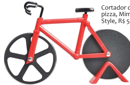
Cortador de pizza, Mimo Style, R$ 52,55