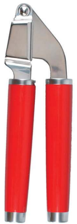
Espremedor de alho, KitchenAid, R$ 139,90