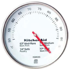
Termômetro culinário, KitchenAid, R$ 82,90