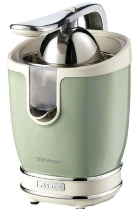
Espremedor Vintage, Ariete, R$ 599