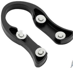
Cortador Alfarabi, James F., R$ 17,90