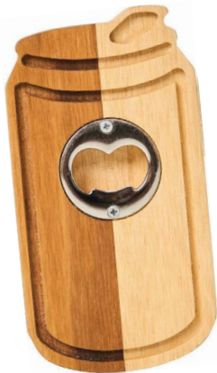
Abridor Teca, Casa 67, R$ 67,90