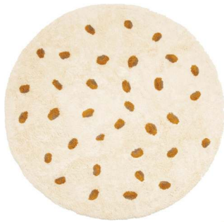
Tapete Dona Onça, Muskinha, R$ 1.540

Poá, xadrez e listras são apenas algumas das estampas que ganharam espaço nas últimas temporadas. Na moda, as padronagens surgem em roupas e acessórios e, nos lares, se destacam em móveis e itens decorativos através de tecidos, tramas e materiais. A seguir, entre na tendência e escolha seus favoritos.