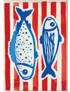
Quadro Peixes, Lartestudio, R$ 231,92