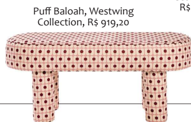
Puff Baloah, Westwing Collection, R$ 919,20