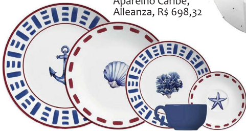
Aparelho Caribe, Alleanza, R$ 698,32