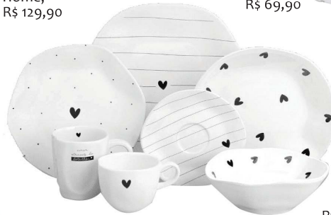
Coleção Amores, Casa Kauã, R$ 515