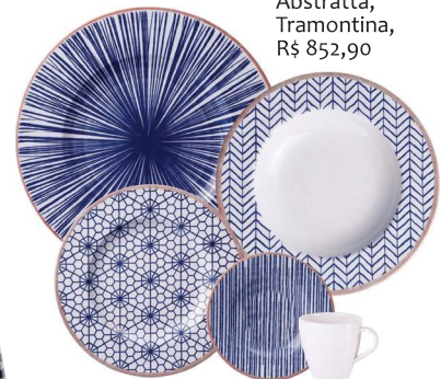
Aparelho de jantar Abstratta, Tramontina, R$ 852,90