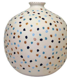
Vaso Balão Poá, Ju Oliveira Studio, R$ 269,90