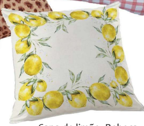
Capa de limão, Rebeca Duarte, R$ 94,60