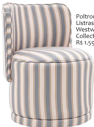
Poltrona Listras, Westwing Collection, R$ 1.599,20