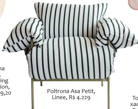
Poltrona Asa Petit, Linee, R$ 4.229