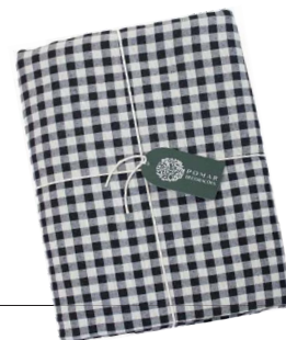
Toalha xadrez, Pomar Decorações, R$ 104,90