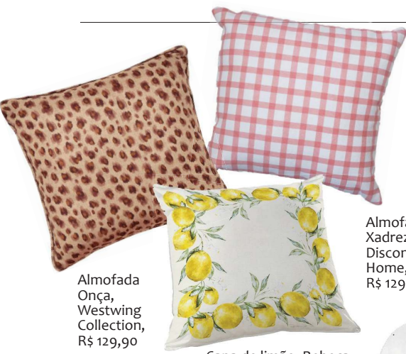
Almofada Onça, Westwing Collection, R$ 129,90