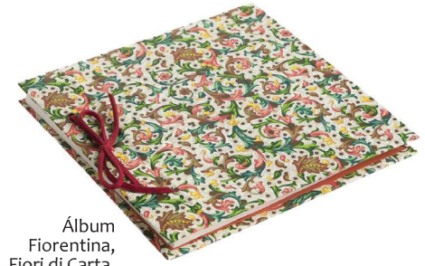
Álbum Fiorentina, Fiori di Carta, R$ 251,92