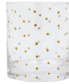
Copo Poás, Westwing Collection, R$ 69,90