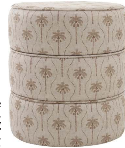
Pufe Gomos, Westwing Collection, R$ 743,92