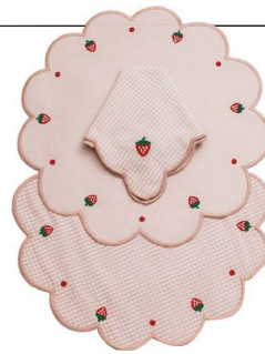
Guardanapo Tutti Frutti Strawberry, Casa Kauã, R$ 65